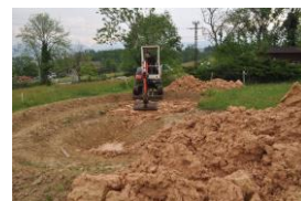
La mini pelle étale l'argile au fond de la future mare.

La mise en eau a permis de tester l'étanchéité. A la fin du confinement l'association Bleepy pourra proposer aux groupes la visite du rucher et de diverses animations. Sur les bords de la mare un petit chalet miellerie va voir le jour et permettra aux visiteurs d'assister à l'extraction du miel. L'association a réalisé l'année dernière un chalet « apivision » qui permet d'ouvrir une ruche devant du public en toute sécurité. Les écoles et autres groupes qui viendront visiter le rucher de Bleepy auront à leur disposition l'ensemble de ces animations.