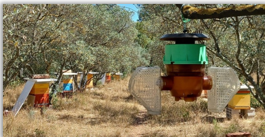
Piège Beevital sur rucher

Le piégeage de printemps est primordial pour endiguer le développement du frelon asiatique. Une action coordonnée et massive sur un secteur permet de capturer un nombre important de reines fondatrices. Ces reines capturées sont autant de nids en moins qui auraient ravagé les ruchers pendant la période estivale. Une communication auprès des apiculteurs et des mairies est cruciale pour arriver à