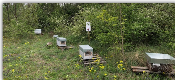
Piège Jabeprode en expérimentation CNR