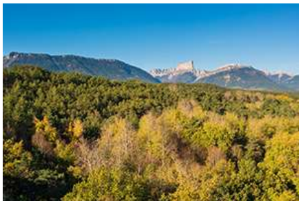
Département de l'Isère

Fruit du regard croisé d'élèves d'écoles du Parc du Vercors et d'artistes de la compagnie Dans tes rêves , cette exposition photographique s'accompagne de deux émissions de Radio Miam à écouter ou ré-écouter . Elle prend naissance au cours du projet pédagogique " À l'école de l'alimentation " coordonné par le Parc du Vercors en 2022-2023, impliquant 15 classes de cycle 2 et 3 sur les enjeux de l'alimentation et de l'agriculture durable.