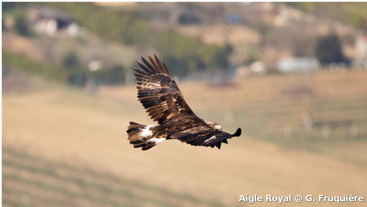
Aigle Royal

Jean Michel Bertrand, auteur du film « Marche avec les loups » est venu nous présenter son film « vertige d'une rencontre » où il nous parle cette fois de la quête de l'aigle. Une soixantaine de personnes a pu en apprendre davantage sur les mœurs de ce magnifique rapace.