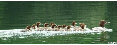
Photo prise le 1 er juin. Cet été 4 familles de harles-bièvres vues sur la Bourne avec de 7 à 13 petits.