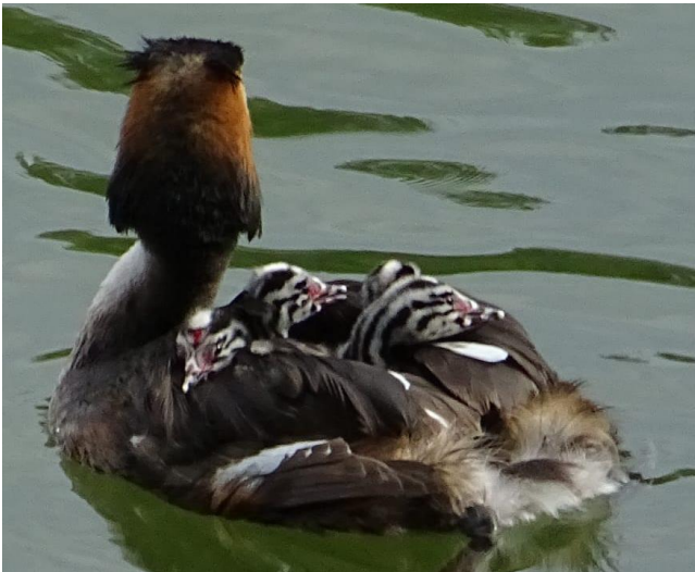
Combien de passagers dans ce bateau ?

Au bout d'environ 5 semaines les jeunes ont grossi et descendent régulièrement du dos de leurs parents. Ceux-là se répartissent alors parfois la portée et les jeunes sont nourris dans l'eau. À environ 9 semaines les jeunes sont autonomes pour pêcher. Les oisillons ont un duvet strié noir et blanc qu'ils gardent jusqu'à l'hiver ainsi qu'une tâche rouge au front qui devient peu à peu orange et finit par disparaître. Ils atteignent leur maturité sexuelle à l'âge de 2 ans. Cette année sur la Bourne, au niveau de St Nazaire-en-Royans, 3 couples ont niché pour le plaisir de nos yeux.