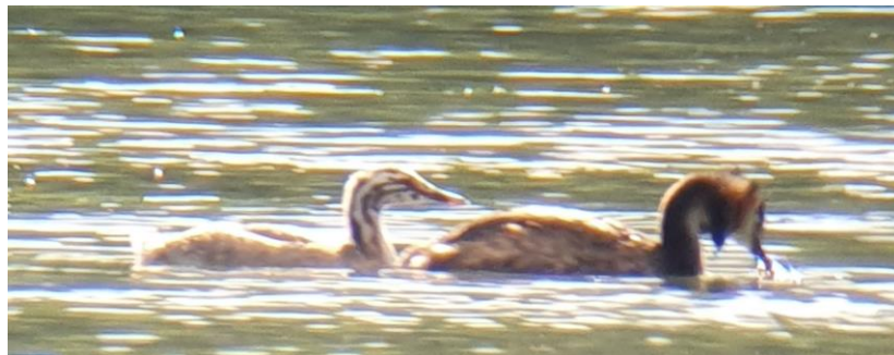
Bébé a bien grandi !

Pour illustrer cet article voici une vidéo créée par la Salamandre, éditeur indépendant et sans but lucratif.